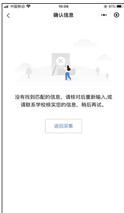
信息无法确认页面