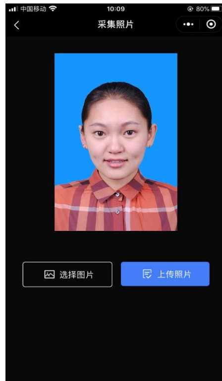
选择照片进行上传