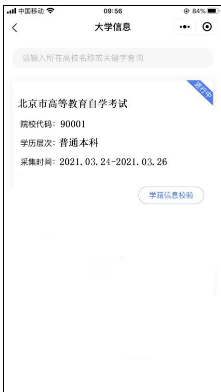
选择相应的学历层次